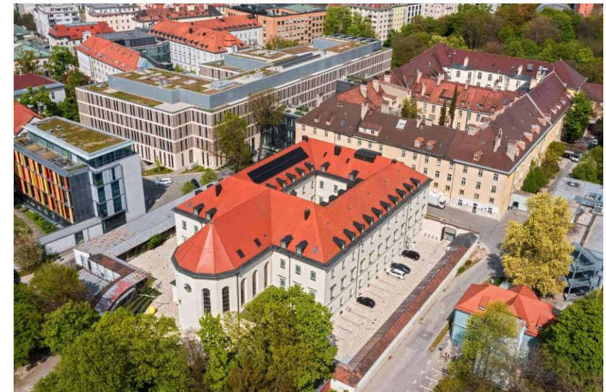
St. Vinzenz Haus, Nußbaumstraße 5, 80336 München

Die Anzahl der Parkplätze vor Ort ist begrenzt. Wir empfehlen die Nutzung von nahegelegenen Parkhäusern oder „Park and Ride“.