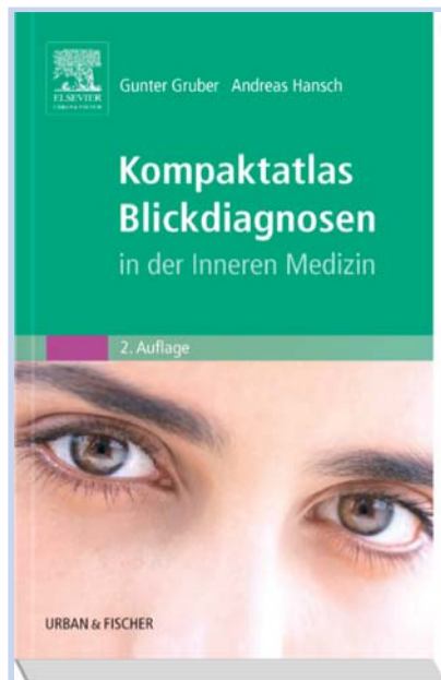
Gunter Gruber, Andreas Hansch (Hrsg.)

Kompaktatlas Blickdiagnosen in der Inneren Medizin Elsevier, München 2009 2. Aufl., 384 S., 400 Abb., 30,95 €