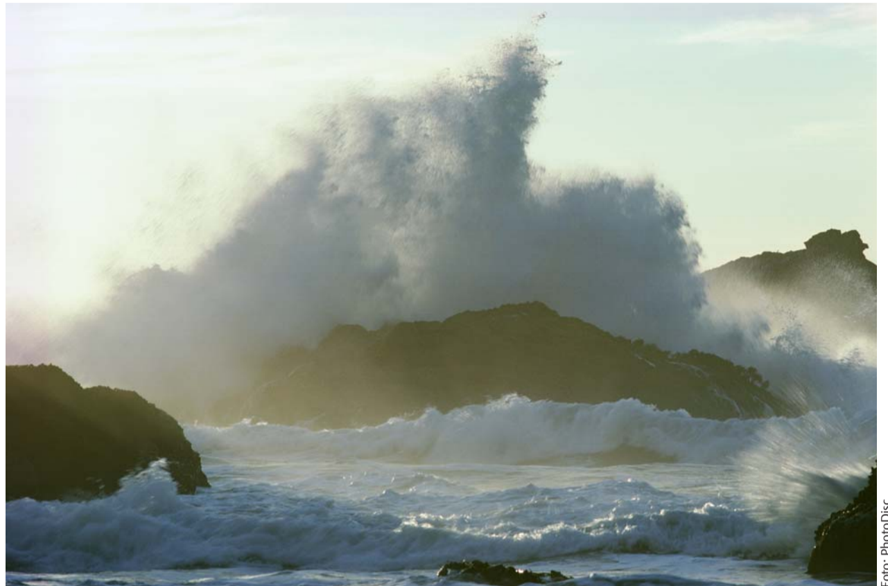
Wie ein Fels in der Brandung: Von den dramatischen Einbrüchen in der Realwirtschaft durch die Finanzkrise zeigt sich die Gesundheitswirtschaft nahezu unbeeindruckt.

Grund zur Besorgnis gibt der Bereich der Pharmabranche in Deutschland. 2008 gab es über 7% weniger Vollzeitstellen als in 2007 – ein Indiz dafür, dass sich die Pharmaindustrie weiter aus Deutschland zurückzieht. Beispielsweise reduzierte Pfizer seine Stellenzahl im Jahr 2008 um ca. 830