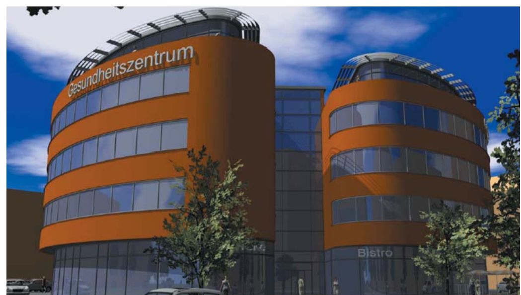
Eingangsbereich des GZ Ludwigshafen