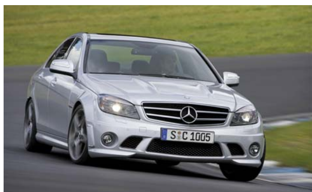
Am liebsten würden alle Versicherten einen „medizinischen Mercedes“ fahren, möglichst ohne ihn bezahlen zu müssen, ...

mit einer radikalen Senkung der Beitragsbemessungsgrenze. Dann könnten viel mehr Menschen in die PKV wechseln. Für die Geringverdiener, Arbeitslosen und Hartz-4 Empfänger käme der Staat (wie in anderen Ländern auch) mit seinen Steuern auf. Dies wäre auch gerecht im Sinne des oben genannten Professors, da die Höchstverdiener auch die meisten Steuern zahlen (10 % der Höchstverdiener zahlen über 50 % des gesamten Einkommenssteueraufkommen) und sich hierdurch auch überproportional „mit ihren starken Schultern“ beteiligen würden. Doch vielleicht wollen diese Gesundheitspolitiker und Kassenvertreter lieber aus „Gerechtigkeitsgründen und Gleichmacherei“, dass alle Bürger im Einheits-Golf (später vielleicht auch im Einheits-Trabi) sitzen sollen. Um dieses Ziel zu erreichen, müsste man konsequenterweise die PKV ganz abschaffen, was aber aus rechtlichen Gründen so einfach nicht ist.