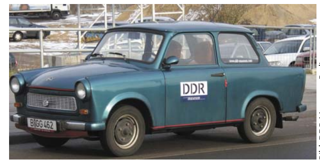
... aber manche Gesundheitspolitiker arbeiten darauf hin, dass alle Bürger bald in einem Einheits-Golf oder gar einem Einheits-Trabi sitzen.

Unser Gesundheitssystem ist viel besser als uns manche Ideologen verkaufen wollen. Nicht umsonst zieht es den Neid des Auslandes auf sich und viele Ausländer lassen sich gerne hier behandeln. Wir haben eine umfassende und gute stationäre und ambulante Behandlung durch qualifizierte und engagierte Ärztinnen und Ärzte. Wir haben keine zeitlichen und/oder altersbedingten Zugangssperren zu unserem Gesundheitssystem. Bei uns ist jeder sofort und umfassend und unabhängig von seinem Einkommen versichert. Unser System, und das ist sein allergrößter Vorteil, kennt keine relevanten Wartelisten sowohl im ambulanten als auch im stationären Bereich. Es ist leistungsstark und kostengünstig. Unser GKV-Leistungskatalog ist der umfangreichste der ganzen Welt. Bezogen auf unser BIP haben wir keine Kostenexplosion, sondern ausschließlich eine Leistungsexplosion in den letzten 20 Jahren erlebt. Diese