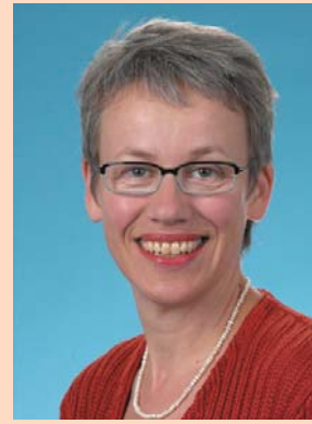
Biggi Bender ist Mitglied des Bundestags und gesundheitspolitische Sprecherin der Bundestagsfraktion Bündnis 90/Die Grünen.

Kurzum: Ein Anstieg der Ärztehonorare ist gerechtfertigt. Die konkrete Höhe wird im nächsten Jahr ausgehandelt werden müssen. Das wird dann zwischen den Selbstverwaltungspartnern geschehen. Doch indirekt ist auch die Bundesregierung beteiligt. Bis zum 1.11.2008 muss die erstmalige Festsetzung eines bundeseinheitlichen Beitragssatzes durch das Bundesgesundheitsministerium für das Jahr 2009 erfolgen. Und bei dieser Festlegung muss selbstverständlich auch die Honorarentwicklung berücksichtigt werden. Der zuständige Abteilungsleiter des Ministeriums hat erst kürzlich auf einer KBV-Veranstaltung eine zehnjährige Steigerung der Ärztehonorare – das wären rund 2,5 Milliarden Euro – als akzeptabel bezeichnet. Die werden aber ohne Beitragssatzsteigerungen nicht zu haben sein. Darüber hinaus hat Ulla