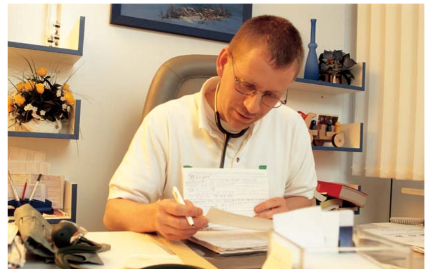
Die Hausärzte sind im Deutschen Hausärzterverband organisiert – auf Seiten der Fachärzte fehlt eine ähnliche Interessenvertretung.