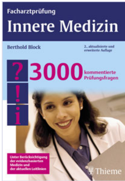
Berthold Block Facharztprüfung Innere Medizin 3000 Fragen für die Facharztprüfung Georg Thieme Verlag, Stuttgart 2006 79,95 €