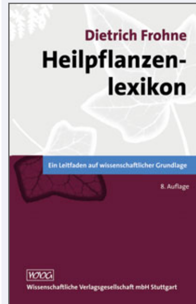
Dietrich Frohne Heilpflanzenlexikon Wissenschaftliche Verlagsgesellschaft mbH, Stuttgart 2007 39,00 €