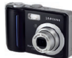
Samsung Digimax S 500 Digitalkamera (5 Megapixel) Prämie Nr. 9