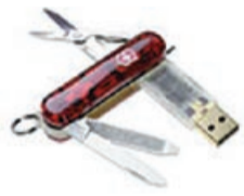
Swissmemory USB Victorinox rubyRED