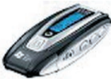
maxfield G-Flash Tragbarer MP3-Player 1 GB silber Prämie Nr. 6