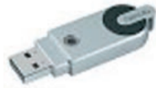
Hama FlashPen Mini 512 MB USB 2.0 Speicher Prämie Nr. 3