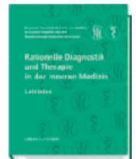
Rationelle Diagnostik und Therapie in der Inneren Medizin Prämie Nr. 11

Alle Prämien haben wir sorgfältig ausgewählt – sollte eine Prämie in der abgebildeten Form nicht mehr verfügbar sein, behalten wir uns vor, Ihnen ein gleichwertiges Produkt anzubieten.