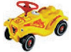
BOBBY CAR Ambulance, gelb Prämie Nr. 13