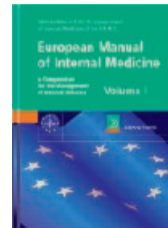
European Manual of Internal Medicine Prämie Nr. 4