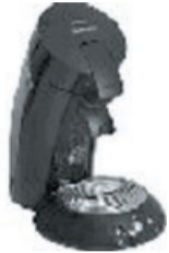
Philips HD 7810/60 Kaffeeautomat Senseo II schwarz oder blau