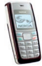
Handy Nokia 1112 (dunkelblau)