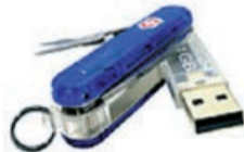
Swissmemory USB Victorinox sapphireBLUE Prämie Nr. 23