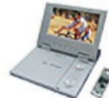
Philips PET 706/Tragbarer DVD-Player mit 7-Zoll LCD-Monitor Prämie Nr. 10