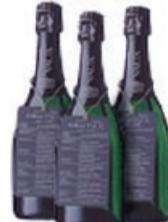
Drei Flaschen Erbacher Marcobrunn Riesling Brut 2003 Prämie Nr. 7