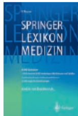
Springer Lexikon Medizin Prämie Nr. 2