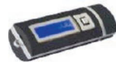
Odys S7 Tragbarer MP3-Player 1 GB in schwarz Prämie Nr. 33