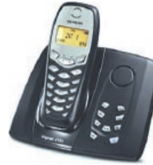
Siemens Gigaset A155 schnurloses DECT Telefon mit Anrufbeantworter dunkelblau