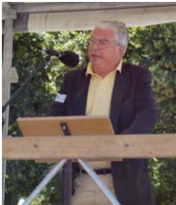
BDI-Vizepräsident Dr. Wolf von Roemer beim 1. Bayerischen Ärzteverbandstag

Beim 1. Bayerischen Ärzteverbandstag am 19.07.06, in München demonstrier-