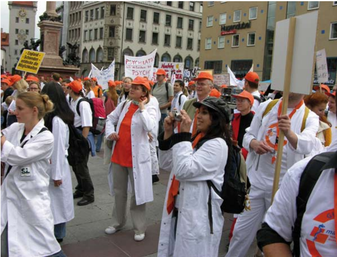
Szenen von der Ärzte-Demonstration auf dem Marienplatz in München