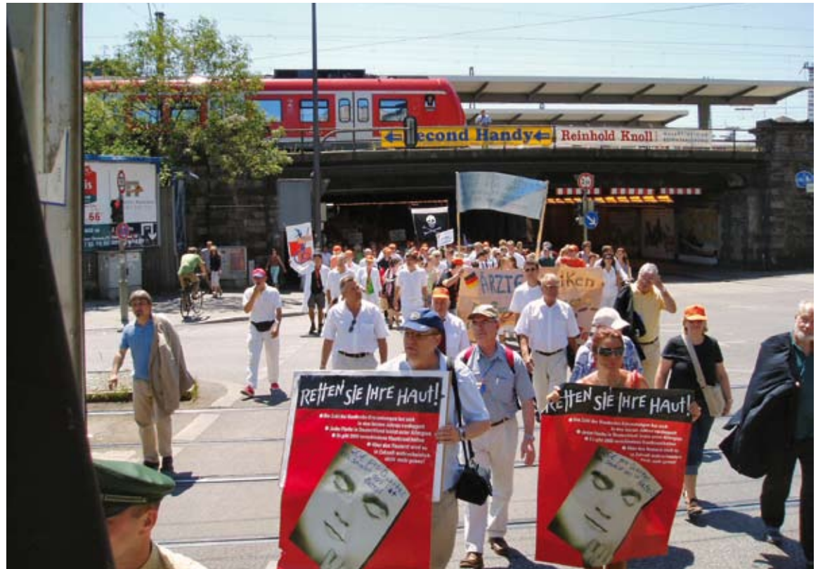
Bayerische Ärzte protestieren gemeinsam auf der Münchner Theresienwiese

über 50% der in Deutschland ausgebildeten Ärzte nach dem Staatsexamen in andere Berufe oder ins Ausland gehen, um sich eine sichere Existenz aufzubauen.