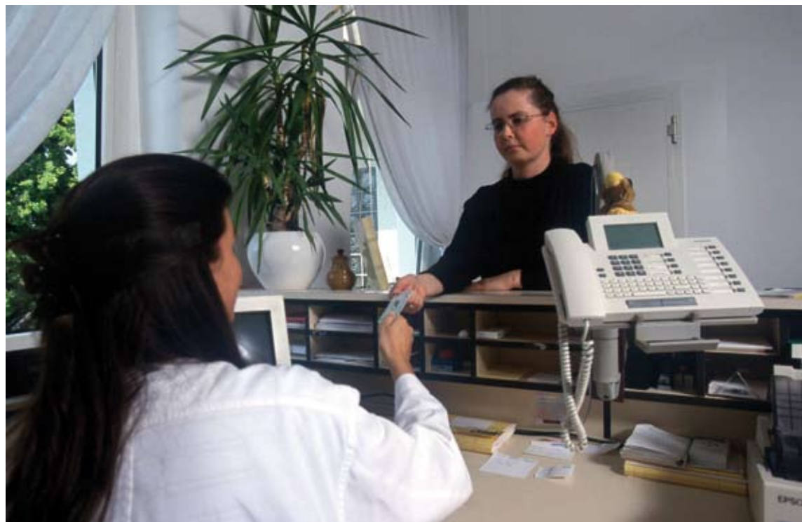
Beim ersten Besuch in der Praxis: 10€

• Bei Männern ab 45 in Verbindung mit der Untersuchung des äußeren Genitals