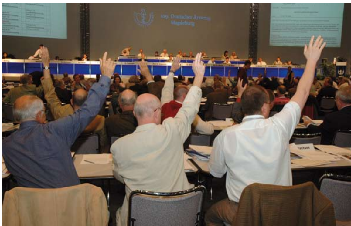
Abstimmung auf dem Deutschen Ärztetag

Die Regierung, hielt er dem Gast aus Berlin vor, ziele mal wieder nur auf ein weiteres Spargesetz und verschiebe die notwendige