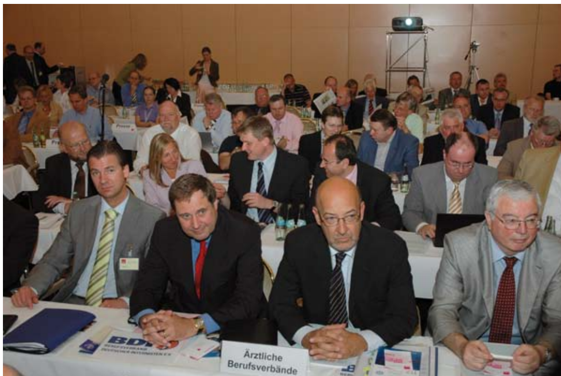
Die BDI-Repräsentanten bei der KBV-Vertreterversammlung

Während die Mehrheit der Vertreter davon ausging, mit diesem Beschluss die Einheit der KBV und der KVen gefestigt zu haben, beharrte wenige Stunden später der Vorsitzende des Deutschen Hausärzterverbands, Rainer Kötzle, auf der Forderung nach einer eigenen hausärztlichen Bundes-KV. Das hatte der Verband wenige Tage vor der Magdeburger Vertreterversammlung beschlossen. Kötzle wertete den Beschluss der KBV-VV als Schritt hin auf dieses Ziel. Dieser Interpretation ►