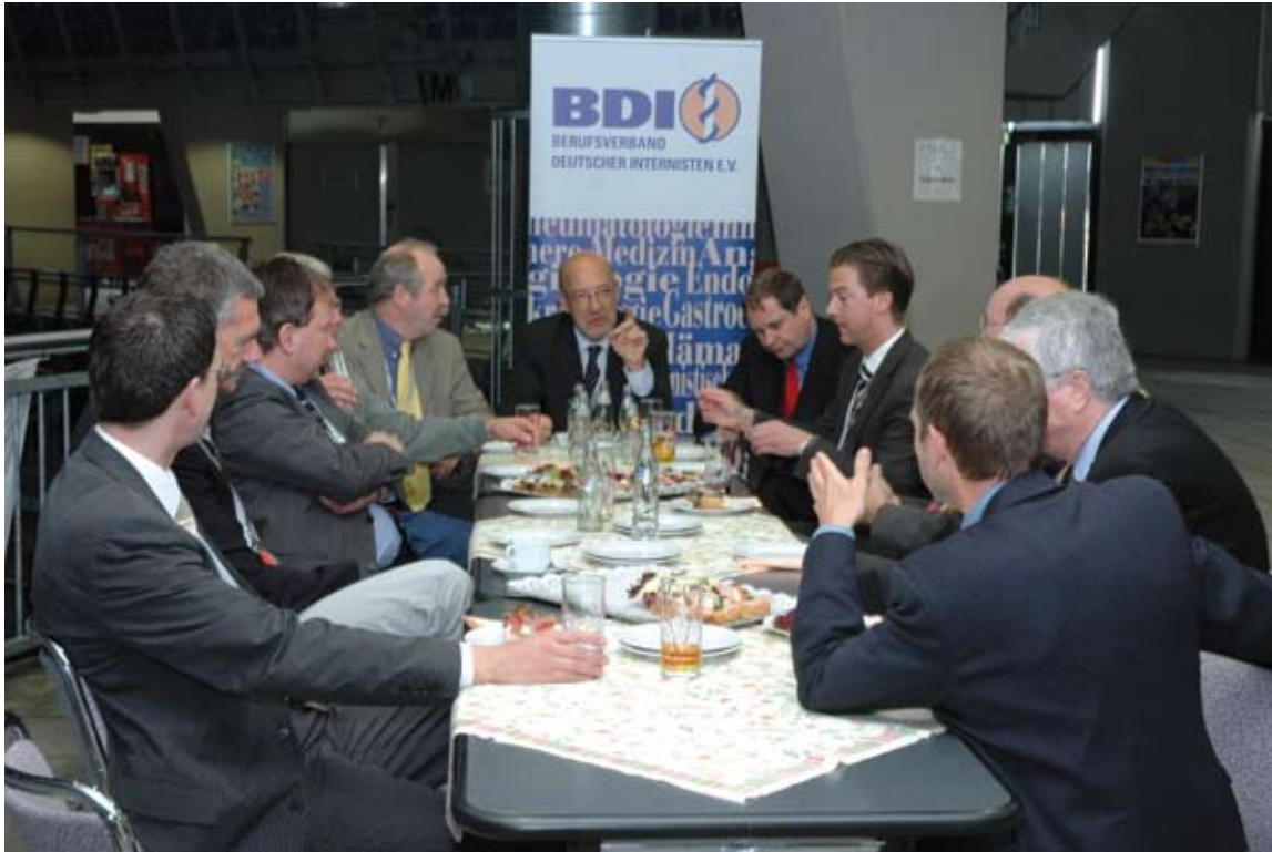
Ärztetags-Diskussion in der „BDI-Insel“

Für eine Stärkung der ärztlichen Psychotherapie und gegen Stigmatisierung psychisch Kranker hat sich der Ärztetag ausgesprochen. Insbesondere der Prävention, Erkennung, Behandlung und Rehabilitation psychischer und psychosomatischer Behandlungen komme in allen Sektoren ärztlichen Handelns eine herausragende Bedeutung zu. Die deutsche Ärzteschaft unterstützt europäische Initiativen, die zu einer stärkeren Mobilität von Patienten und Ärzten in der Europäischen Union führen, fordert aber, dass damit keine Harmonisierung im Gesundheitswesen verbunden sein darf. Auch dürfe es keine administrativen Belastungen für die Ärzte und keine „Standards“ für strukturelle Rationierungen geben. Wartelisten, wie sie in einigen EU-Mitgliedstaaten praktiziert werden, könnten nicht als Vorbild dienen, erklärte der Ärztetag in Magdeburg. Der Deutsche Ärztetag hat „Zehn Gebote“ für das Erbringen individueller Gesundheitsleistungen (IGeL) verabschiedet. Die Empfehlungen sollen Ärzten dabei helfen, die von den Patienten selbst zu zahlenden Leistungen seriös und verantwortungsvoll anzubieten. Jedes Angebot einer individuellen Gesundheitsleistung müsse der hohen ärztlichen Verantwortung gegenüber Patientinnen und Patienten gerecht werden, heißt es in dem Beschluss von Magdeburg. Nur so bleibe das für den Erfolg jeder Heilbehandlung unverzichtbare Vertrauensverhältnis zwischen Patienten und Ärzten erhalten. KS