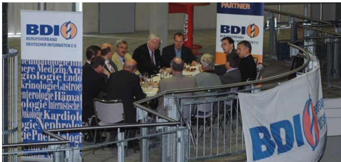
Allianz Deutscher Ärzteverbände