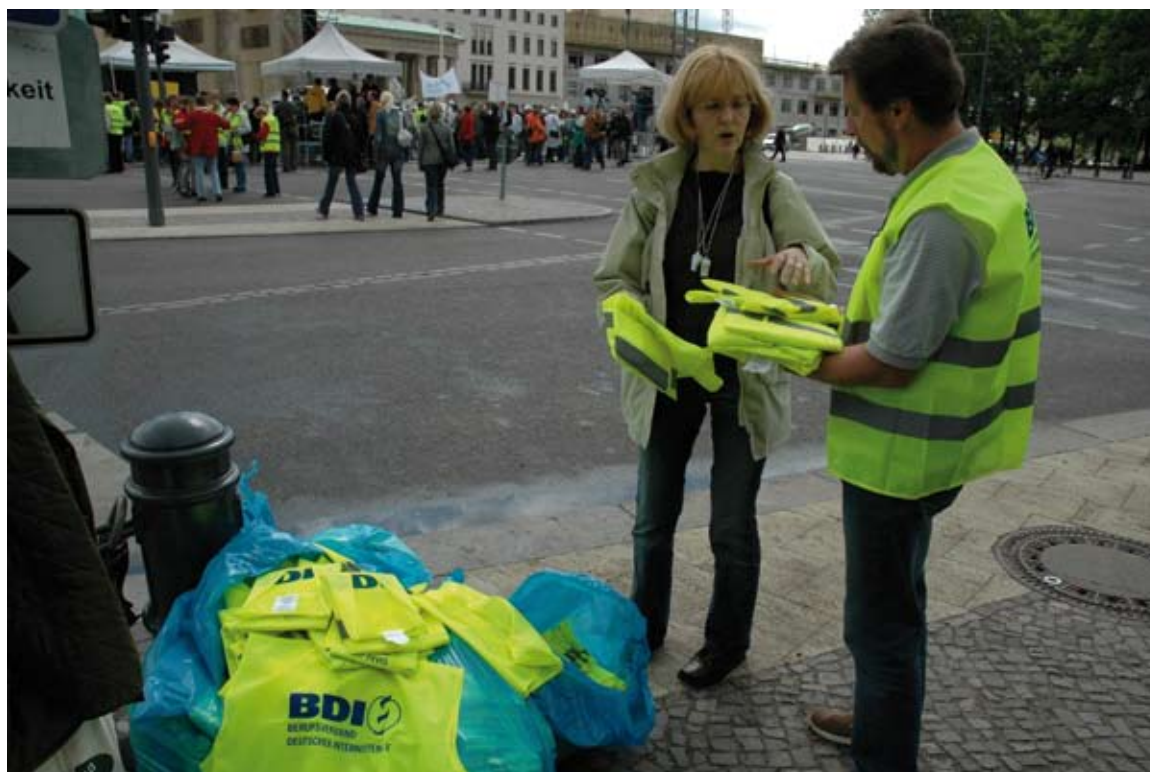
Der BDI verteilt Westen an die Demonstranten

Das Gegenteil ist richtig: Die Unterfinanzierung der gesetzlichen Krankenversicherung wird ohnehin schon ausschließlich mit dem Engagement von uns Ärzten kompensiert. Wir finanzieren seit Jahren den medizinischen Fortschritt durch sinkende Punktwerte