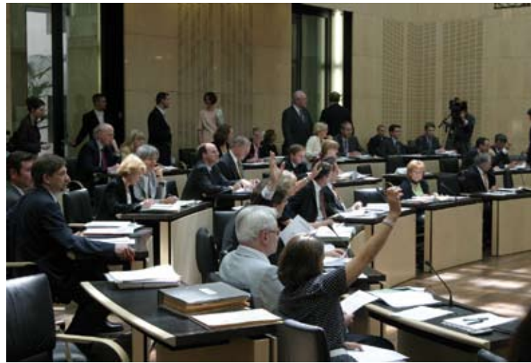
Abstimmung im Bundesrats-Plenum

die Spitzenverbände der Krankenkassen bis zum 1. Januar 2006 über die Praxis der generellen Befreiung Kran-