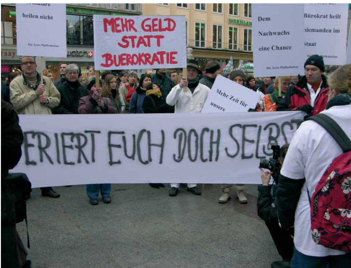
„Tag der Ärzte“ in München

• Die Selbstverwaltung in Gestalt der Kassenärztlichen Bundesvereinigung und der Spitzenverbände der Krankenkassen ist momentan nicht in der Lage, die Regelleistungsvolumina zeitgerecht umzusetzen. Dies bedeutet, dass die unglückselige Situation nach Einführung des EBM 2000 plus mit den zahlreichen unterschiedlichen Honorarverteilungsverträgen in den Länder-KVen und der damit verbundenen unterschiedlichen Vergütung der Arztgruppen von KV zu KV bestehen bleiben wird. Bundesgesundheitsministerin Ulla Schmidt hat deshalb bereits die Selbstverwaltung kritisiert, dass sie ihre Hausaufgaben nicht erledigt hat. Das Unvermögen, im Bewertungsausschuss zu einer Lösung dieses Problems zu kommen, ist eine Steilvorlage für das Bundesgesundheitsministerium, Alternativlösungen der Vergütung durch ein unabhängiges Institut voranzutreiben. Schmidt wird mit Sicherheit die Gelegenheit nutzen, ihre früheren Pläne wieder aufleben zu lassen, die Geschäftsführung des Bewertungsausschusses der Kassenärztlichen Bundesvereinigung wegzunehmen, um einen unabhängige ▶