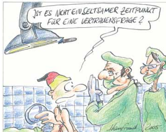
Patient Deutschland –