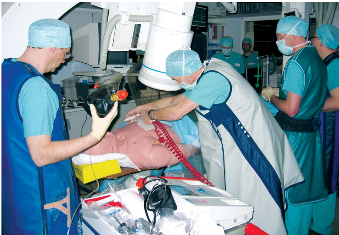
Ein Puppenspielzeug ist der Simulator nicht – hier kann sich der interventionelle Kardiologe wie im richtigen Leben fühlen.

Was nicht heißen soll, dass sie unbrauchbar wären. Nein, ganz im Gegenteil. Simulatoren sind eine Bereicherung für den Ausbildungsalltag. Als Ergänzung zur klinischen Ausbildung der Ärzte am Patienten erlauben es uns die Simulatoren insbesondere praktische Fertigkeiten sehr zeiteffizient, für jeden Arzt individualisiert zu erlernen. Und dies alles, ohne dabei einen Patienten zu gefährden oder zu belasten. Nie darf man jedoch den Lernenden mit seinem Simulator allein lassen, immer sollte ein erfahrener Kardiologe zur Supervision